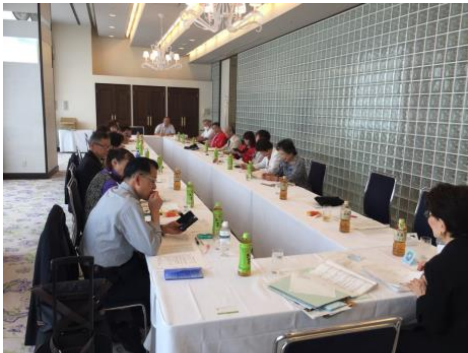
広報委員会の様子