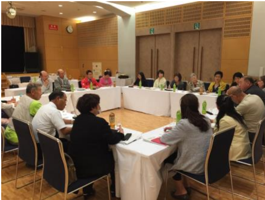
総務委員会の様子