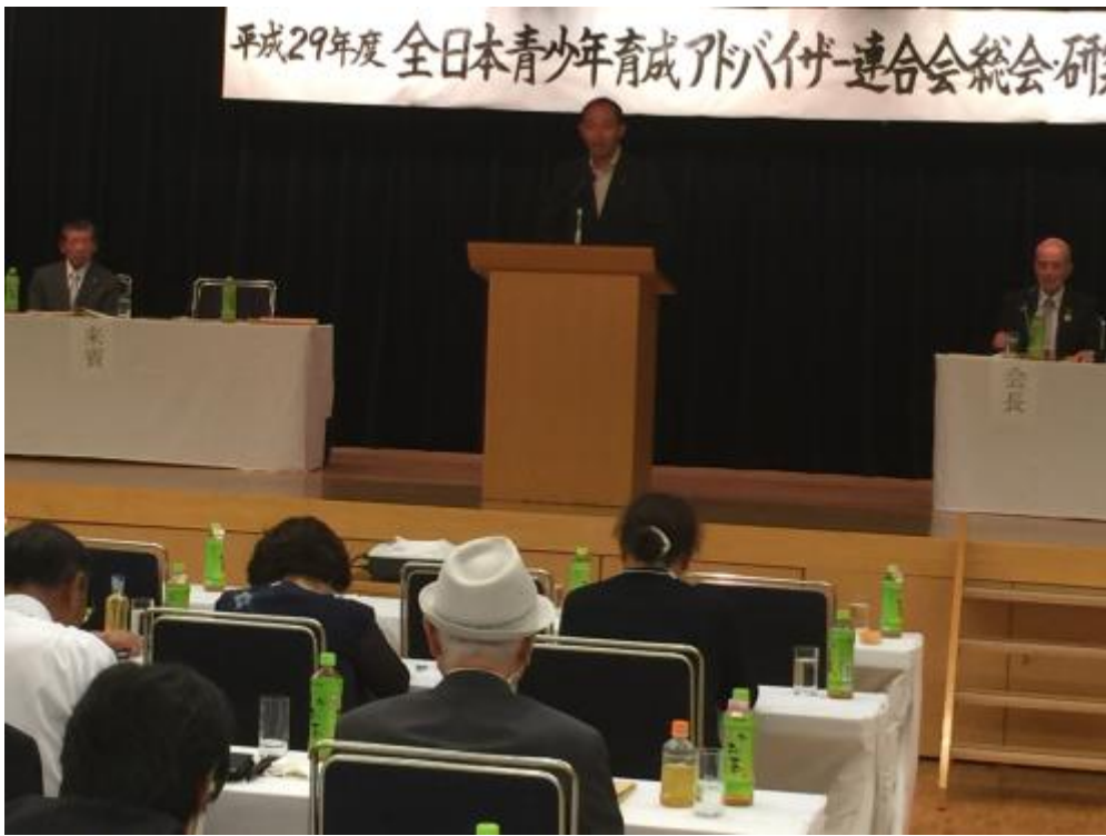
岐阜県環境生活部長 坂口芳輝様のご挨拶