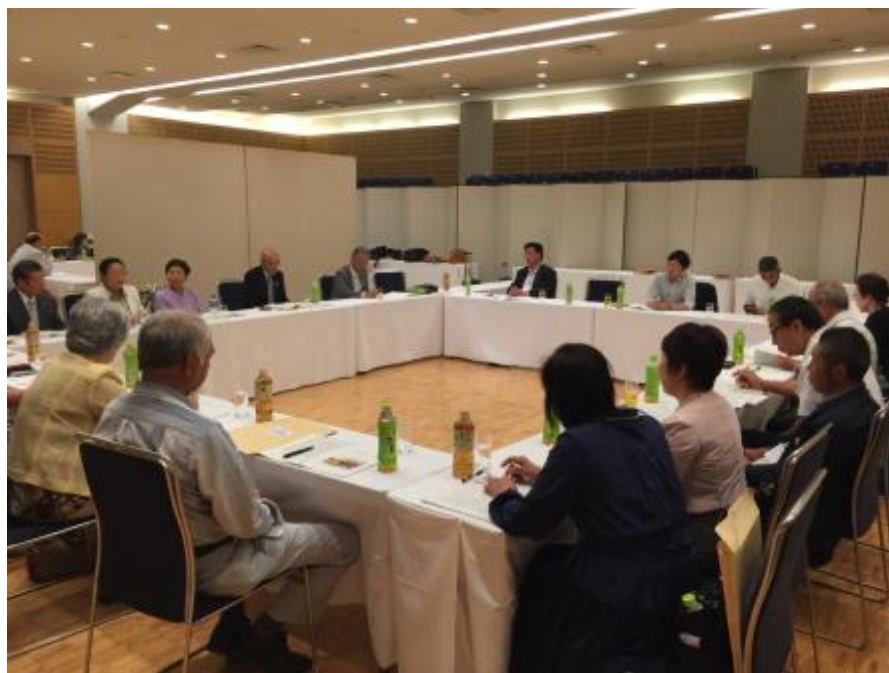
後継者養成委員会の様子