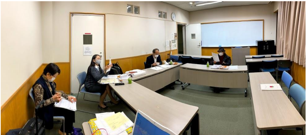
国立オリンピック記念青少年総合センターにて

全日本青少年育成アドバイザー連合会の運動「子どもが伸びるチャンスを生かす運動」「ありがとう100回運動」「地域の子どもは地域で育てる」など、これまで私たちは実践してきました。今こそ誰でも出来るこれらの挨拶、声掛けをこのコロナ禍の中で、もっと積極的に実践して参りましょう。